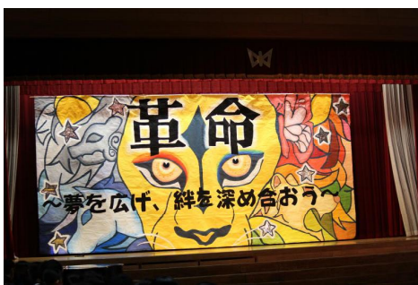
ステージ背景「革命」