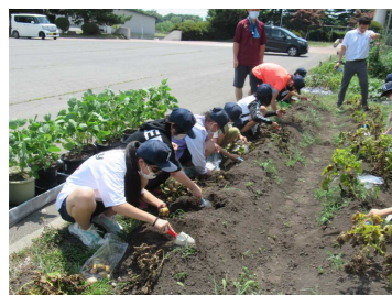
6年生(8月3日) 夏休み中の芋掘り

児童会活動のテーマが決定しました。各学級から出された意見を、運営・体育委員会の話し合いで3つに絞り、全校児童の投票によって今年度のテーマが決定しました。児童会を中心に、このテーマに向かって主体的に取り組めるように支援していきます。