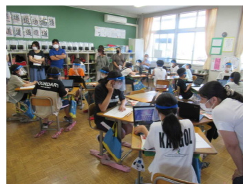
5年生(7月14日) 参観日の授業風景