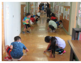
縦割り(7月16日) 大掃除