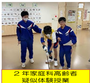
2年家庭科高齢者疑似体験授業