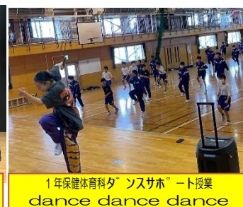
1年保健体育科ダ'ンスサポ'ート授業 dance dance dance