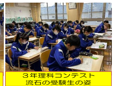
3年理科コンテスト 流星の受験生の姿