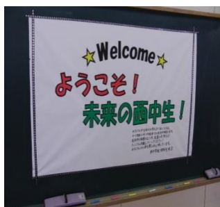
1学年生徒会制作の歓迎ポスター

十二月十三日から十五日の三日間、今年度二回目の丸ごと参加日を開催しました。この三日間は、授業はもちろんのこと、朝の会から放課後の部活動まで自由に参観できます。仕事の休憩時間に給食の様子を見に来た方、中学生最後の授業姿を見に来た三年生の保護者の方など多数来校されました。参観した方々からは、「廊下ですれちがう子がみんなあいさつをしてくれた。」「場所が分からずうろろしていたら、声を掛けてもらいうれしかった。」「授業に集中していて安心した。」等の感想が寄せられました。また、初日には、泉川小学校の六年生九十二人が授業見学会として来校しました。数名の班に分かれ、校内に散らばり、真剣に見学しておりました。後日届いた感想には、「むだ話がなく全員が集中していた。」「授業のスピードが速いけど、楽しそうだった。」「校舎は古いけどきれいで、ゴミが落ちていない。」「西中生がとてもかっこよかった。」「中学生になるのは不安だったけど、見学して、早く中学生になりたいと思った。」「などと書かれておりました。 来年の春、未来の西中生が、希望を胸に、入学してくる日が楽しみですよ！