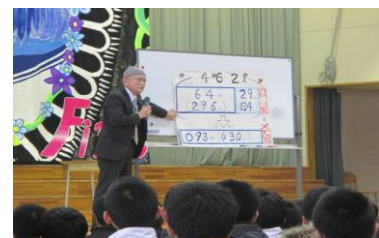
グラフを使ってお話しする校長先生

12月13日の全校集会で、校長先生が評価結果について、“西中に入学してよかった”と回答している生徒が昨年度より1%増えている。しかし、そうは思わないという生徒も数名いる。今後、生徒会を中心にみんなが満足できる学校づくりに取り組むようお話ししました。