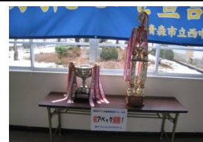
PTAバレーの巨大なカップ&トロフィー