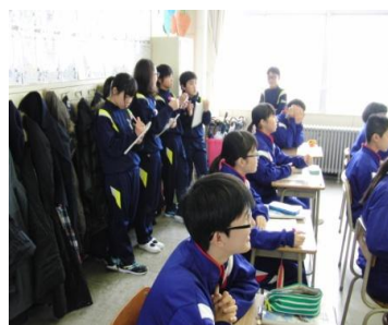
メモを取りながら真剣に見る小学生