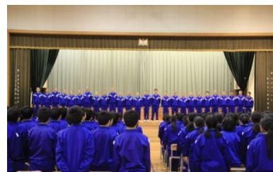
祈り必勝！野球部いざ全国大会へ

平成28年度、全校生徒489人の挑戦により西中学校は大きく成長しました。次年度も一層の飛躍をめざして生徒・教職員一丸となって頑張ります。