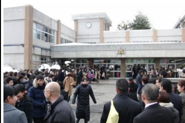
後輩、先生、保護者による見送り