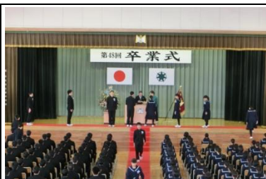
凛とした空気の中行われた卒業証書授与

卒業生合唱『巣立ちの歌』の一節にもあるように、卒業生一人一人の「輝かしい明日の日」をこれからも応援し続けます。