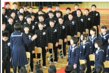
式場を感動の渦に巻き込んだ別れの詩