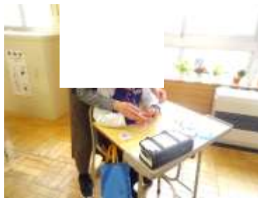
5年生 家庭科「玉結び・玉止め」