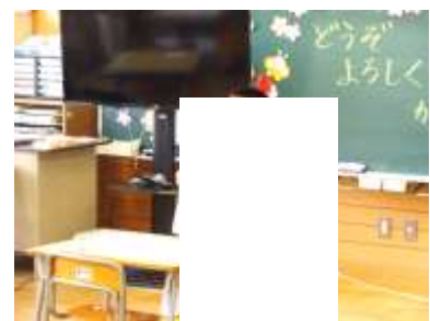
1年生 どうぞよろしくのかい