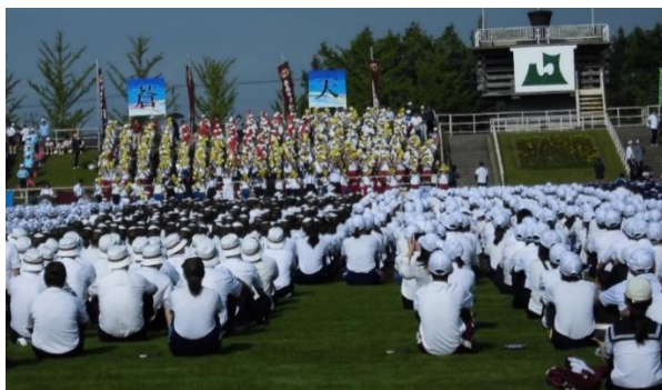
各地からの参加選手を応援