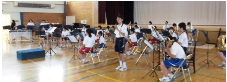
7月11日 吹奏楽部 壮行演奏会

東北大会への出場権のかかった県大会は 7月28日リンクステーションホールで 開催されます。